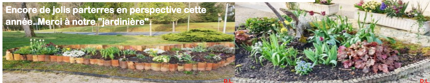
Encore de jolis parterres en perspective cette année. Merci à notre "jardinière"

Cap sur Giscos n° 15 Avril 2019 Responsable de publication: J.P. Capes Rédaction & Photos : F. Barbot, N. Vivas et D. Lalès PhotosWeb-Réalisation et impression: D. Lalès