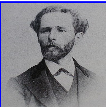
Félix Arnaudin (1844-1921)